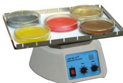
翹板搖擺式震盪器