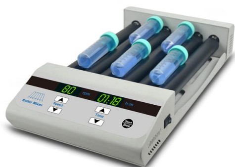
LM-80T / LM-80S